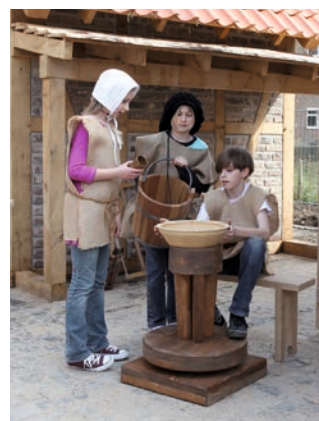
Töpfern an einer mittelalterlichen Töpferscheibe

Mit dem Projekt „Grafschafter Musenhof“ gewann Moers 2008 den Förderwettbewerb „Standort Innenstadt NRW“. Ziel war nicht nur, Schloss und Schlosspark mit der Innenstadt enger zu verbinden, sondern auch den Wirtschaftsstandort Innenstadt zu stärken. Die Idee: Eltern gehen einkaufen, Kinder lernen spielerisch und mit Spaß etwas über Geschichte. Teile des Projektes sind, neben der mittelalterlichen Spiel- und Lernstadt, die „Große Tafel“, die Herrichtung des Rosengartens (Rosarium) und die „Moerser Meilensteine der Geschichte“, die zum Schloss hinführen.