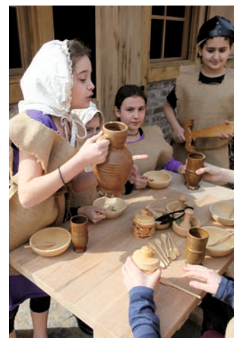
Noch ein Schluck aus dem Schankkrug?