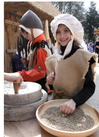
Im Mittelalter in Moers verboten: Kommahlen mit der Handmühle

In der Lernstadt können Kinder in Rollen schlüpfen: in die eines wohlhabenden Händlers, der Gewürze in die Stadt bringt und sich als einziger Bürger in der Stadt Bleiglasfenster leisten kann; in die Rolle des Bubenkönigs – eine Art mittelalterlicher Polizist, der auf alle Spitzbuben aufpasst – oder in die Rolle des einfachen Ackerbürgers, der ein Handwerk ausübt, Ziegen und Schweine hält und Felder bestellt.