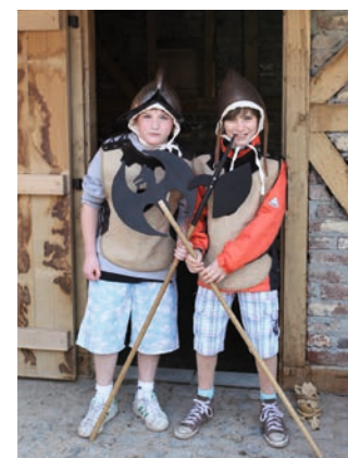
Torwachen kontrollieren den Einlass in die mittelalterliche Stadt