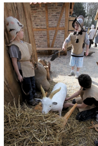
Hat der Melkknecht etwas angestellt?