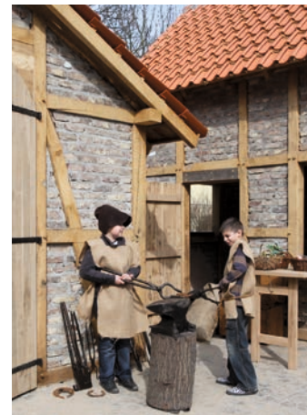
Muss Schwerstarbeit leisten: der Schmied