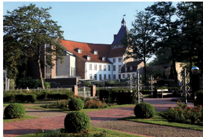
Das „Rosarium“ - ein weiterer Baustein des Grafschafter Musenhofes

Mit dem Projekt „Grafschafter Musenhof“ gewann Moers 2008 den Förderwettbewerb „Standort Innenstadt NRW“. Ziel war nicht nur, Schloss und Schlosspark mit der Innenstadt enger zu verbinden, sondern auch den Wirtschaftsstandort Innenstadt zu stärken. Die Idee: Eltern gehen einkaufen, Kinder lernen spielerisch und mit Spaß etwas über Geschichte. Teile des Projektes sind, neben der mittelalterlichen Spiel- und Lernstadt, die „Große Tafel“, die Herrichtung des Rosengartens (Rosarium) und die „Moerser Meilensteine der Geschichte“, die zum Schloss hinführen.